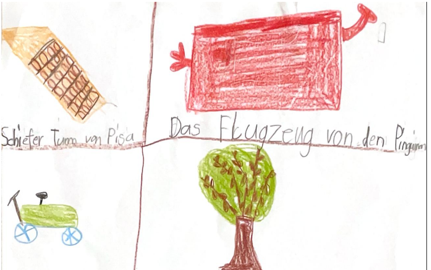
Schiefer Turm von Pisa